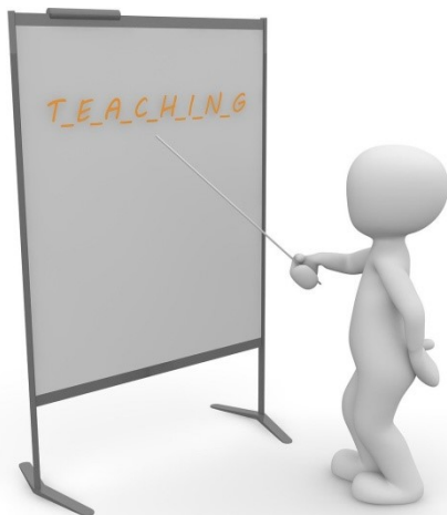
Με φυσική παρουσία